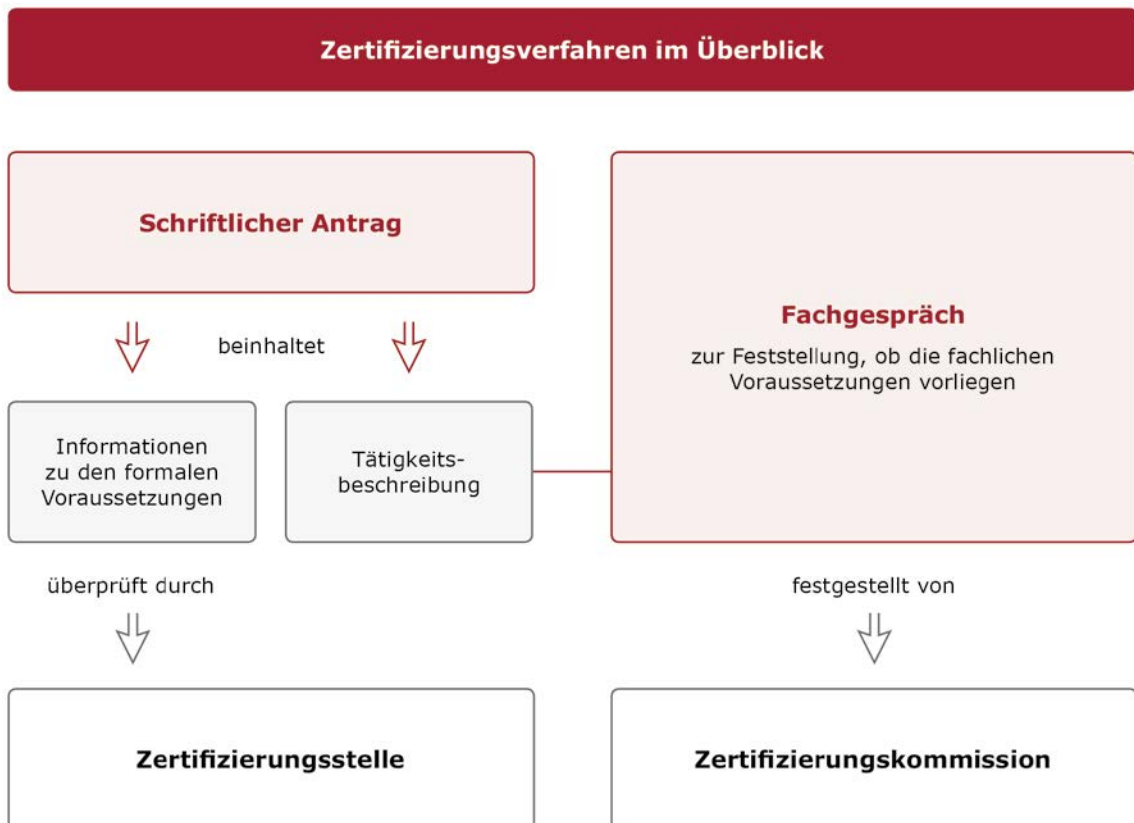
Abbildung 1: Zertifizierungsverfahren im Überblick

■ Fachgespräch: Das Fachgespräch bildet den zweiten Teil des Zertifizierungsverfahrens. Dieses findet zwischen dem/der Antragsteller/in und der Zertifizierungskommission statt. Die zwei Fachexperten/-expertinnen der Zertifizierungskommission stellen anhand von festgelegten Kriterien fest, ob der/die Antragsteller/in die fachlichen Voraussetzungen für den Erwerb der Ingenieur-Qualifikation erfüllt.